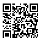
Image may differ from the actual product